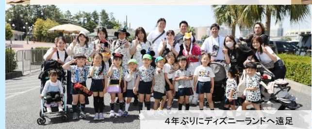
4年ぶりにディズニーランドへ遠足