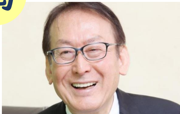
<エッセイ>国語力が子供たちの人生の土台をつくる