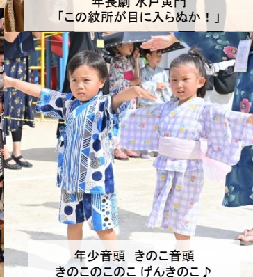
年少音頭 きのこ音頭 きのこのこのこげんきのこのこ