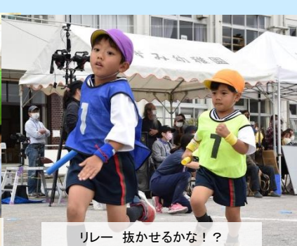
リレー 抜かせるかな！？