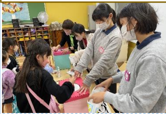
お菓子の掘み取り