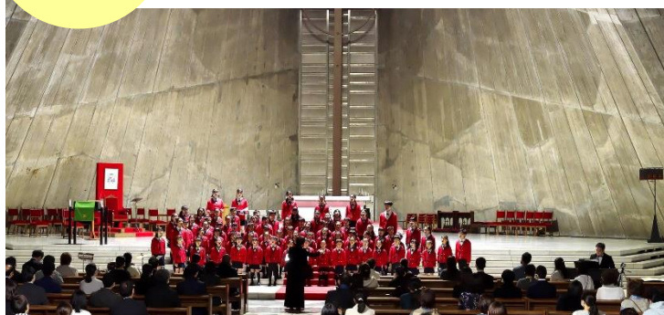
令和4年12月 念願の教会で響き渡る美しい頭声