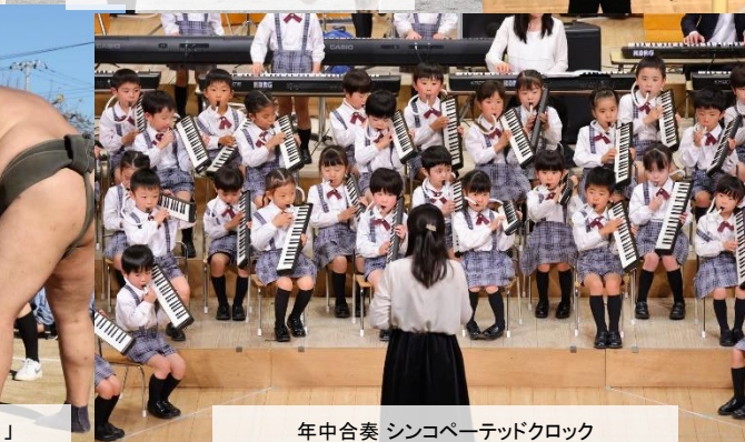
年中合奏 シンコペーテッドクロック