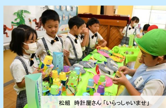
松組 時計屋さん「いらっやいませ」