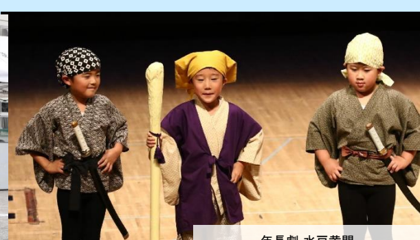
年長劇 水戸黄門 「この紋所が目に入らぬか！」