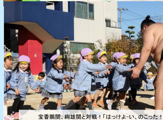
宝香鵬関、絢雄関と対戦！「はっけよーい、のこった！」